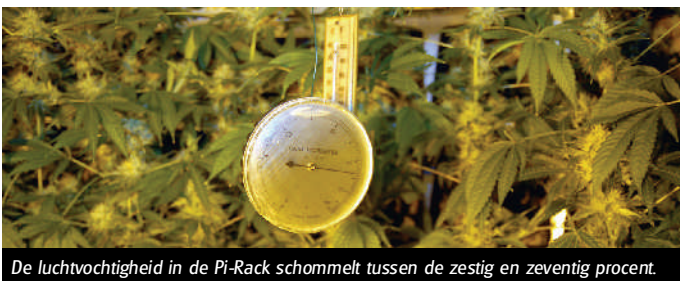
De luchtvochtigheid in de Pi-Rack schommelt tussen de zestig en zeventig procent.

van de potten: 3,5 liter is lekker ruim. Dat belooft wat voor de omvang van de oogst!